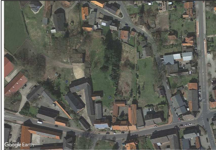
Luftbild Nutzungen im Plangebiet

Die Prägung im Bestand entspricht einem Dorfgebiet, auch wenn im Gebiet selbst Landwirtschaft nur noch als private Tierhaltung betrieben wird. Der gesamte Bereich Gifhorner Straße / Dorfring weist die historische Prägung des Rundlingsdorfes auf.